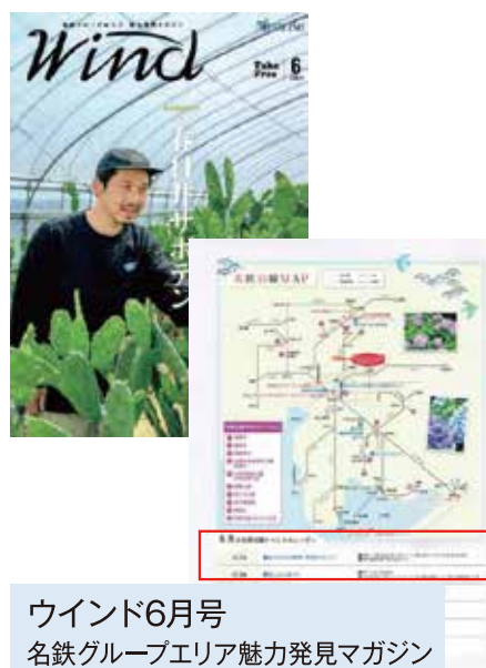
ウインド6月号 名鉄グループエリア魅力発見マガジン