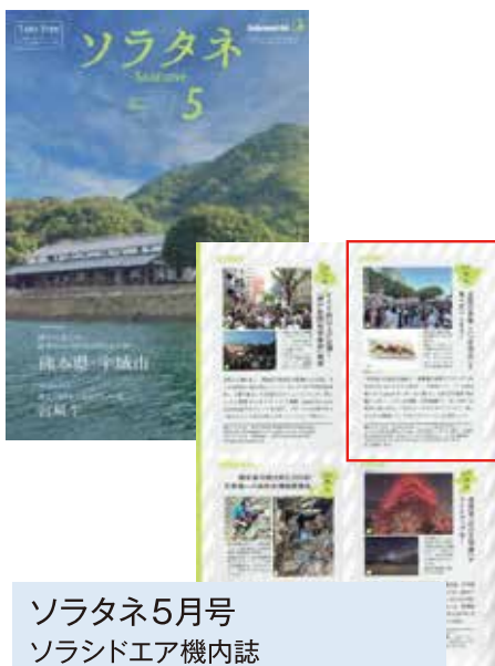
ソラタネ5月号 ソラシドエア機内誌