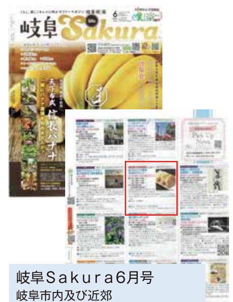
岐阜Sakura6月号 岐阜市内及び近郊